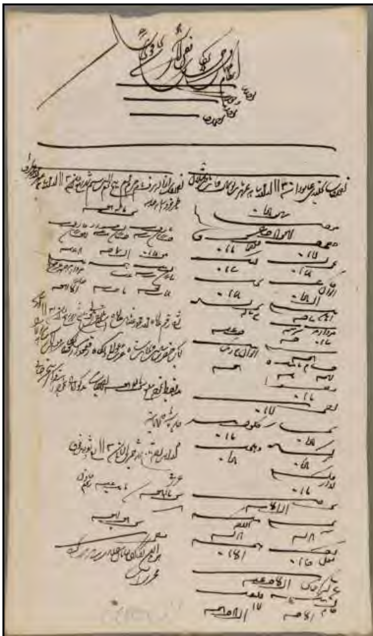
سند شماره ۱: هزینه های نخل بندی در عاشورا سال ۱۱۳۰ ق.