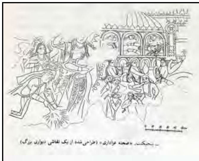
تصویر شماره یک

هرچند برای اولین بار استفاده از واژه نخل در دوره صفویه رایج می‌شود و حتی برخی آن را از بدعت‌های این دوره می‌دانند (بلوک‌باشی، ۱۳۸۰: ۵؛ قاسمی‌ندوشن، ۱۳۸۰: ۵). اما براساس منابع موجود آدابی مشابه آن از ادوار گذشته در ایران رایج بوده است. ابن جوزی در کتابش در شرح وقایع سال ۴۲۵ ق. اشاره می‌کند که در اوایل ماه رمضان عده‌ای از عیاران از جمله دو جوان اصفهانی در هنگام رفتن به زیارت قبر «مصعب بن زبیر» مجانیقی را ساختند و با خود به همراه بردند. وی در ادامه می‌نویسد که این کار آنان مشابه کار شیعیان محله کرخ بغداد بود که در نیمه شعبان به منظور زیارت سیدالشهدا به کربلا می‌رفتند (ابن الجوزی، ۱۴۱۲: ۲۴۱). البته ابن جوزی توضیحی در مورد چرایی این تقلید و علت حمل این وسیله و شکل ظاهری آن ارائه نمی‌دهد؛ اما شاید بتوان آن را نوعی تابوت واره به حساب آورد که شکل مذهبی به خود گرفته است. ۱