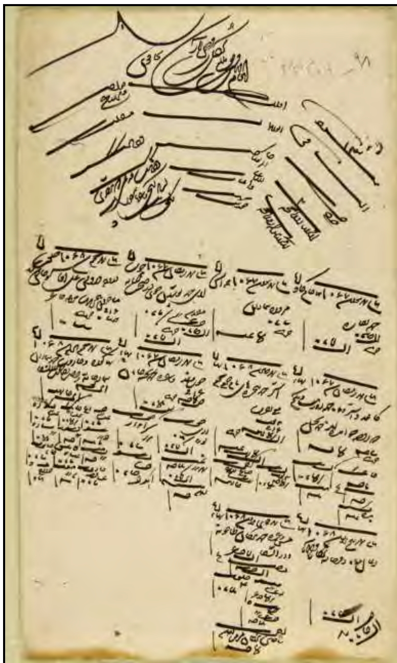
سند شماره ۴: نخستین سند مربوط به نخل‌بندی ۲۱ ماه رمضان سال ۱۰۶۷ق.