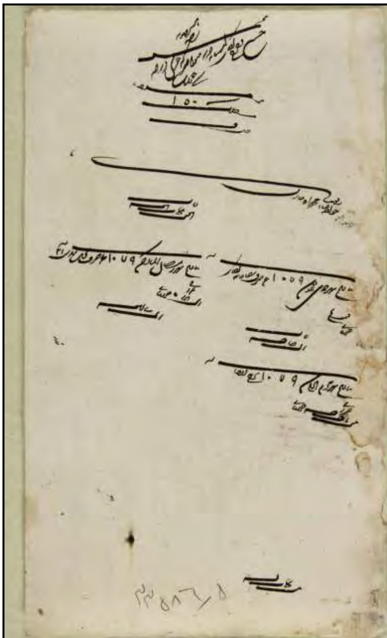
سند شماره ۲: هزینه های نخل بندی در محرم و رمضان سال ۱۰۷۹ ق.