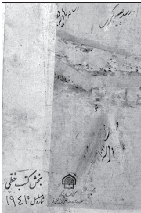
تصویر ۳: کشف الآيات قطب شاهي، کتابخانه مرعشي، شماره ۱۹۴۱۰، ابتدای نسخه