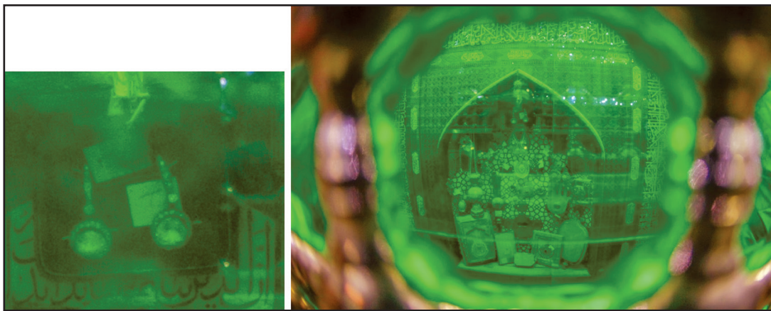
تصویر ۴: گوشواره‌های الماس تقدیمی شوکت‌الملک موجود در ضریح مطهر حضرت علی (ع)