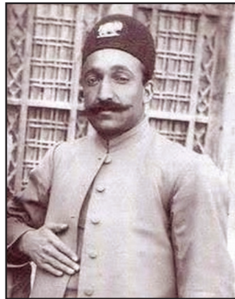
تصویر ۱: محمدابراهیم خان شوکت الملک

یافتند. محمدابراهیم خان در ۱۳۲۲ ق/ ۱۹۰۴ م پس از فوت برادرش محمد اسماعیل خان، توسط مظفرالدین شاه به حکومت قائنات و سیستان منصوب شد و لقب «امیر شوکت الملک» را دریافت کرد. او به واسطه فتوای آخوند ملا محمد کاظم هروی خراسانی و ارتباط نزدیک با سید محمد طباطبایی و سید عبدالله بهبهانی، به طرفداران مشروطیت پیوست. او پس از آنکه به این سمت منصوب شد، سعی می‌کرد در منطقه تحت حکمرانی اش نظم و سامان ایجاد کند، به طوری که جهت افزایش امنیت این مناطق، مدرسه افسری شوکتیه را تأسیس کرد و واحدهایی نظامی با حمایت و بودجه کنسولگری انگلیس تشکیل داد. هدف انگلیس از حمایت او، ایجاد منطقه ای امن به منظور حفظ هندستان بود. امیر محمدابراهیم خان در اواخر دوره قاجار از رضاخان، سردار سپه، حمایت کرد و در هنگام قیام کلنل محمدتقی خان پسیان به دستور دولت مرکزی با او مقابله کرد. او در دوره رضاشاه پهلوی، در ۱۳۱۵ ش/ ۱۹۳۸ م استاندار فارس شد و پس از مدتی نیز در چند کابینه به وزارت پست و تلگراف منصوب شد. پس از آنکه رضاشاه از سلطنت برکنار شد، او نیز از مناصب دولتی کناره‌گیری کرد و به املاک وسیع خود در بیرجند رسیدگی می‌کرد. محمدابراهیم خان شوکت الملک دوم سرانجام در شب عید غدیر ۱۳۲۲ ش/ ۱۹۴۳ م در ۶۴ سالگی از دنیا رفت و جسد او را در حرم امام رضا (ع) (قسمتی مخصوص امرای این خاندان)، دفن کردند. اسدالله علم یکی از چهار فرزند او بود که بعدها به عنوان نخست وزیر محمدرضا شاه پهلوی منصوب شد. (آیتی، ۱۳۲۷: ۱۳۳-۱۳۸؛ منصف، ۲۵۳۵: ۳۵-۳۶، ۴۰، ۴۲، ۴۵-۴۶، ۵۰-۵۲، ۵۷-۵۸؛ شاهی، ۱۳۷۹: ۲۵-۳۹)